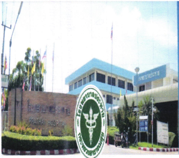
Prathai Hospital โรงพยาบาลประจักษ์ ตั้งโรงพยาบาล ขาด 61 กิโลเมตร